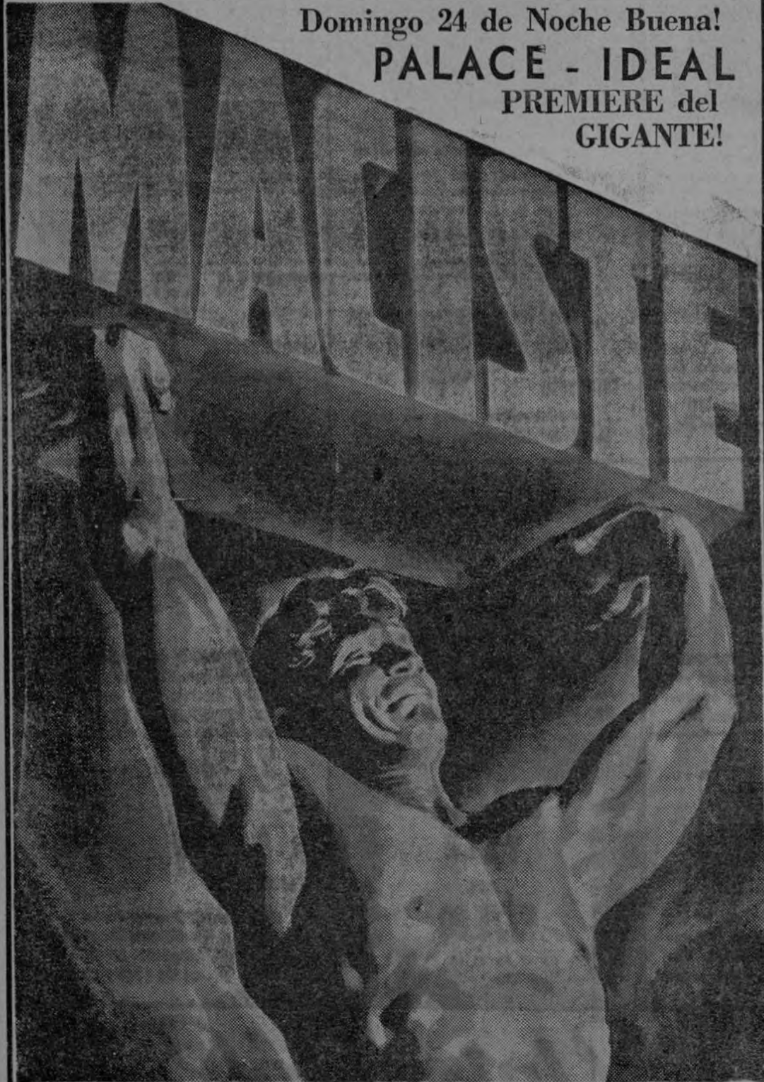
EN LA TIERRA DE LOS CICLOPES.

Domingo 24 de Noche Buena! PALACE - IDEAL PREMIERE del GIGANTE!